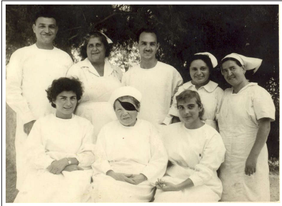
חלק מאנשי הצוות הרפואי בבית החולים על שם הנסן

ניסיון העברה ראשון: רחוב הנביאים במרכז העיר (1963) הפעילות הרפואית בבית החולים הדסה שבהר הצופים פסקה לגמרי במלחמת העצמאות, כאשר הר הצופים הפך למובלעת בחסות האו"ם בלב שטח ירדן. פעילות בית החולים