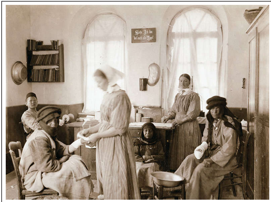
עבודת הצוות עם המטופלים

מאורעות תרצ"ג, 8 מצאה את ביטויה גם בבית המצורעים. באוגוסט 1934, מספר חודשים לאחר סיום המאורעות, פנו שלושה מהמטופלים היהודים לנציגת ועד הקהילה בירושלים וביקשו לעזוב את המוסד. לטענתם, הם לא יוכלו להישאר עוד במקום הואיל ו"החולים הערבים מכים אותם ואין הרופא והאחות מגינים עליהם". 8 מבדיקת נציגת הוועד עלה כי גם המטופלים היהודים האחרים סובלים מאלימות, ובעקבות כך מספרם במוסד צנח. במענה לשאלותיה של הנציגה החלה אחות במקום להתלונן על חולים שמפריעים ומרגיזים את הצוות הרפואי ואת שאר החולים, אך עד מהרה הוסיפה כי "כתוצאה מהמחלוקת השוררת בין היהודים והערבים בארץ [...] רוגזים החולים, בני העדה אחת על אחרים, ותמיד הם רבים ביניהם. לדעת האחיות אי אפשר לטפל בחולי צרעת יהודים וערבים, אם הם נמצאים ביחד". 9 מעדותה של האחיות הראשית עולה כי גם במהלך שנת 1935 התקיימו עימותים