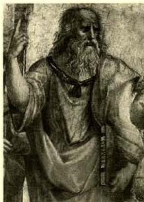
אפלטון. קטע מתמונתו של רפאל (1510) "המדרשה האתונאית"

הטבעי בין אזרח לחברו, צדק שבבסיסו מידורם בכפייה של האזרחים לתפקידים חברתיים התואמים את תכונותיהם הטבעיות. במדינה זו הכוח הצבאי נתון בידי מסדר של שומרים שחונכו מינקות לשמירה על הציבור, ולשם כך נאסרות עליהם אחזקת רכוש וגם התנהגות ואפילו מחשבה המכוונות לטובתם האישית; השלטון נתון בידי מיטב הפילוסופים שלמדו במשך כל חייהם את כל ענפי הידע הדרושים לניהול עיר משגשגת. למרבית מבקריה של תמונה זו היא נראתה אמנם יפהפייה ואצילית, אך לוקה בחוסר מציאותיות.