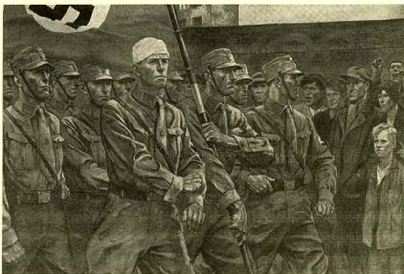
"כך היה ה-SA" ציור מאמצע שנות השלושים של הצייר הנאצי אלק אָבר. לפי המקטרגים, חייל המשמר הנאצי הוקם במתכונת ה"שומרים" של אפלטון

הפוליס האידיאלית של אפלטון אמונה, אם כן, על השימוש בכלים טוטליטריים כדי להשיג את מטרתה הגדולה: מניעת מלחמת מעמדות והתקוממות הפועלים על מושליהם. 19 "הפילוסופיה של אפלטון", מסכם קרוסמן, "היא המתקפה הפראית והמעמיקה ביותר על עקרונות הליברליות שההיסטוריה מסוגלת להראות". 20 אכן, אין אצל אפלטון ולו רמז לאמון בתבונתו של 'האזרח הפשוט' לבחור בעצמו את המסלול הטוב והצודק לניהול חיי המדינה. אך האם באמת מדובר ב'מתקפה פראית'? האם הנכונות להשתמש בשקר שלא מתוך כוונת זדון, אלא כדי להסביר להמוני הנבערים מדעת אמת עמוקה וחיונית דרך אגדה, שקולה בהכרח לתעמולה הרצחנית והצינית של מנגנון התעמולה הנאצי? דומה שהדמיון שקרוסמן מצא בין אפלטון לנאציזם בעניינים אחרים סחף אותו עד כדי חיפוש זהות גם במקום שבו אין למצוא אותה, שהרי הוא אינו טוען שדמוקרטיה ליבראלית איננה משקרת לאזרחיה לעולם, או שאם היא עושה כן היא מפעילה בהכרח רק תעמולה שסופה אלימות ורצח.