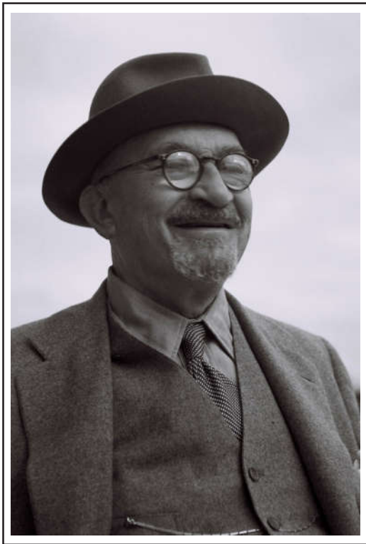
חיים ויצמן, 1874–1952, נשיאה השישי של ההסתדרות הציונית העולמית

בית המשפט' לפני בתי הדין שיוקמו על ידי האומות המאוחדות, 1 לשם העמדתם לדין והענשתם של פושעי המלחמה". 2 זו הייתה הפעם הראשונה שהועלתה הכוונה לבקש מבעלות הברית ייצוג ליהודים במשפטים העתידיים, בתפקיד מה שמכונה בז'רגון המשפטי 'ידיד בית המשפט' (מלטינית: Amicus Curiae ) – הווה אומר, מי שהוגדר על ידי בית המשפט כניטרלי וכמי שאינו קשור לאף אחד מהצדדים המתדיינים, ושכוחו לסייע לו בבירור האמת, על סמך ניסיונו האישי וידיעותיו הרלוונטיות לחקירה. למעשה, כה חשוב היה הנושא, מנקודת מבט יהודית, עד כי באותה העת ביקש הקונגרס היהודי העולמי, כמייצגו של העם היהודי, לשמש 'ידיד בית המשפט' במשפטים העתידי של פושעי המלחמה הבין-לאומיים. במקביל, ביקשו