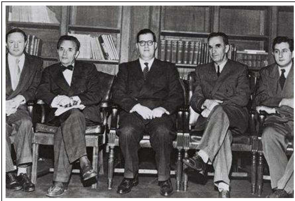
יעקב רובינסון, 1889–1977, ראש המכון לענייני יהודים של הקונגרס היהודי העולמי וככל הנראה האישיות היהודית המעורבת ביותר במשפטי נירנברג, במשלחת ישראל לאו"ם (1950), שני משמאל

הגבלת הצגת העדות אך ורק לשופטים תהיה בוודאי טעות חמורה. למעשה, הדבר לא יהיה אפשרי. המשפט יהיה ציבורי. עיתונות ורדיו מכל העולם ייוצגו שם. ההזדמנות הייחודית לבטא 'אני מאשים' מרעיד עולמות [Earth-shaking Jaccuse] נגלית לנו, ומוטלת עלינו החובה לנצלה. דבר פחות מהצהרה כזו לא יצדיק את העדות. היא חייבת, ללא ספק, להיות מאורע היסטורי – כמו לדוגמה, הופעתו של ויצמן לפני ועדת פיל [Peel Commission] – שבכוחו לפנות הן לרגשותיהם של בני האדם והן לשכלם. א