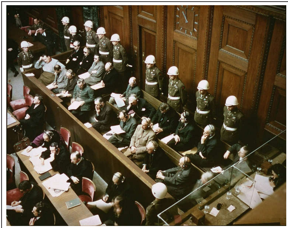
ראשי המשטר הנאצי מוקפים שומרים צבאיים באולם בית המשפט בנירנברג

אבקש להעלות עתה שתי שאלות נוספות: ראשית, עד כמה היה מעשי להניח, בשלב זה, כי דבר העדות יצא לבסוף אל הפועל? ושנית, האם ייתכן שויצמן, כמי שבקיא בפוליטיקה